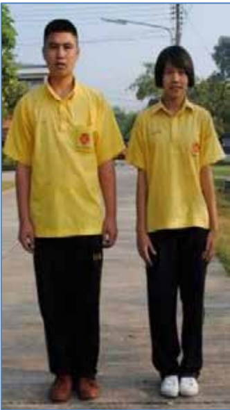
ชุดพละ ม.ต้น

รองเท้า นักเรียนชาย ใช้รองเท้าผ้าใบสีขาว หรือสีน้ำตาล ห้ามใส่สีอื่นเด็ดขาด นักเรียนหญิง ใช้รองเท้าผ้าใบสีขาว ห้ามใส่สีอื่นเด็ดขาด