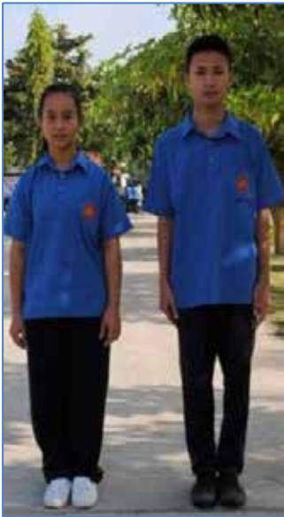
ชุดพละ ม.ปลาย

รองเท้า นักเรียนชายใช้รองเท้าผ้าใบสีขาว หรือสีดำห้ามใส่สีอื่นเด็ดขาด นักเรียนหญิง ใช้รองเท้าผ้าใบสีขาว ห้ามใส่สีอื่นเด็ดขาด