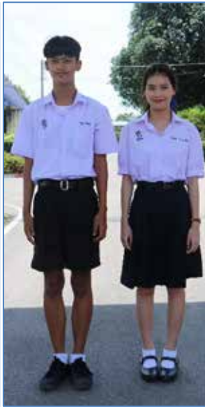
ชุดนักเรียน ม.ปลาย