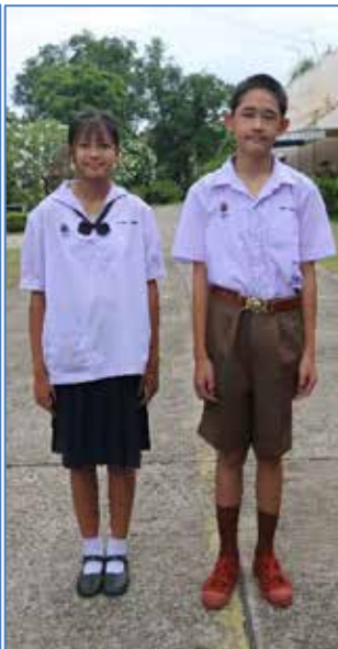
ชุดนักเรียน ม.ต้น