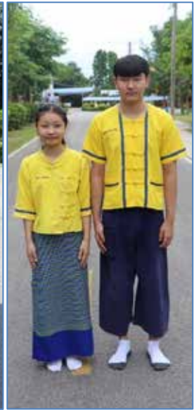
ชุดพั่นเมือง