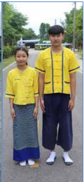
ชุดพื้นเมือง